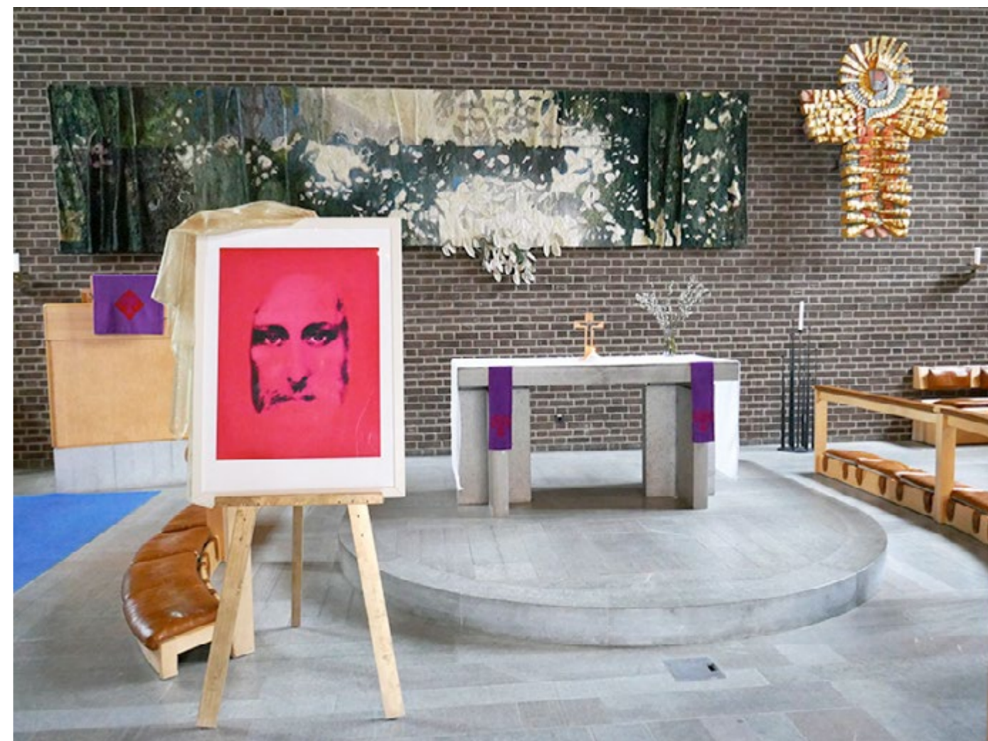
"Rött Kristusansikte" - Dagen efter Terrorattacken vid Sergels Torg, Skärholmens Kyrka, Påsk 2017

Jag fick en vision om att gestalta en färgkontemplativ pilgrimsvandring för påskhögtiden, där man kan följa passionsdramat genom de olika Kristusporträtten. Bilderna kan påminna om de faser/ faser Kristus upplevde i sin vandring på Golgata, men även om Pånyttfödelse, Uppståndelse och det Nya Hoppet. Porträtten ger utrymme för mångfacetterade, kreativa tolkningsmöjligheter och får en unik betydelse i varje betraktares ögon, även beroende på bildens färgklang.