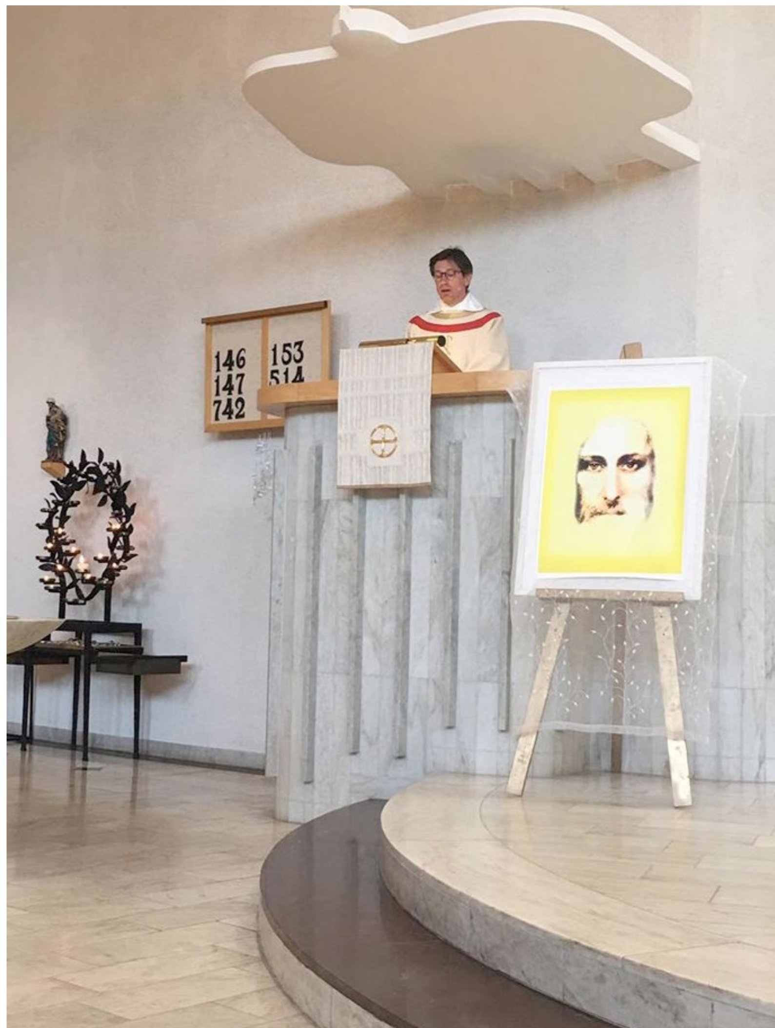
The Vicar Jerker preaching on Påskaföton 2019, In the foreground Yellow Christ, printed on canvas 60 x 80 cm