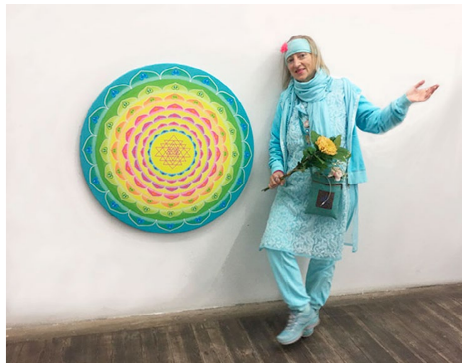
"Annualrings", "Årsringar", Konstnärshuset, ", Giclée tryck på Canvas 2019