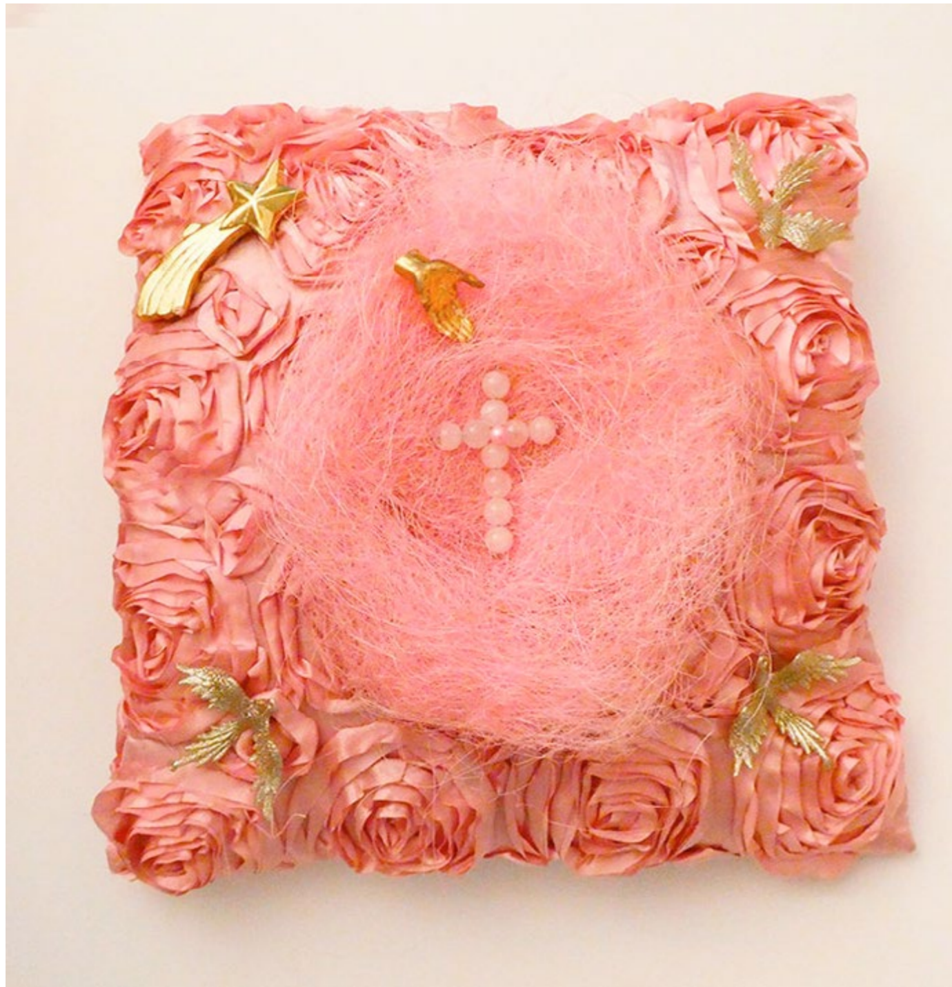
Installation vid huvudaltaret i Hamneda Kyrka, "Kärlekens Kors", 2020-21. Den Nyfödde, symboliseras av Korset i Rosenkvarts, vilar på en bädd av rosa halm, Omgiven av 3 ÄnglaFåglar, som symboliserar de tre vise männen, eller Änglahorder, T.h. Guds Hand i en Givande Gest, högst upp "Betlehems Stjärna". Invigning av utställningen skedde på Julafton kl 23.00.