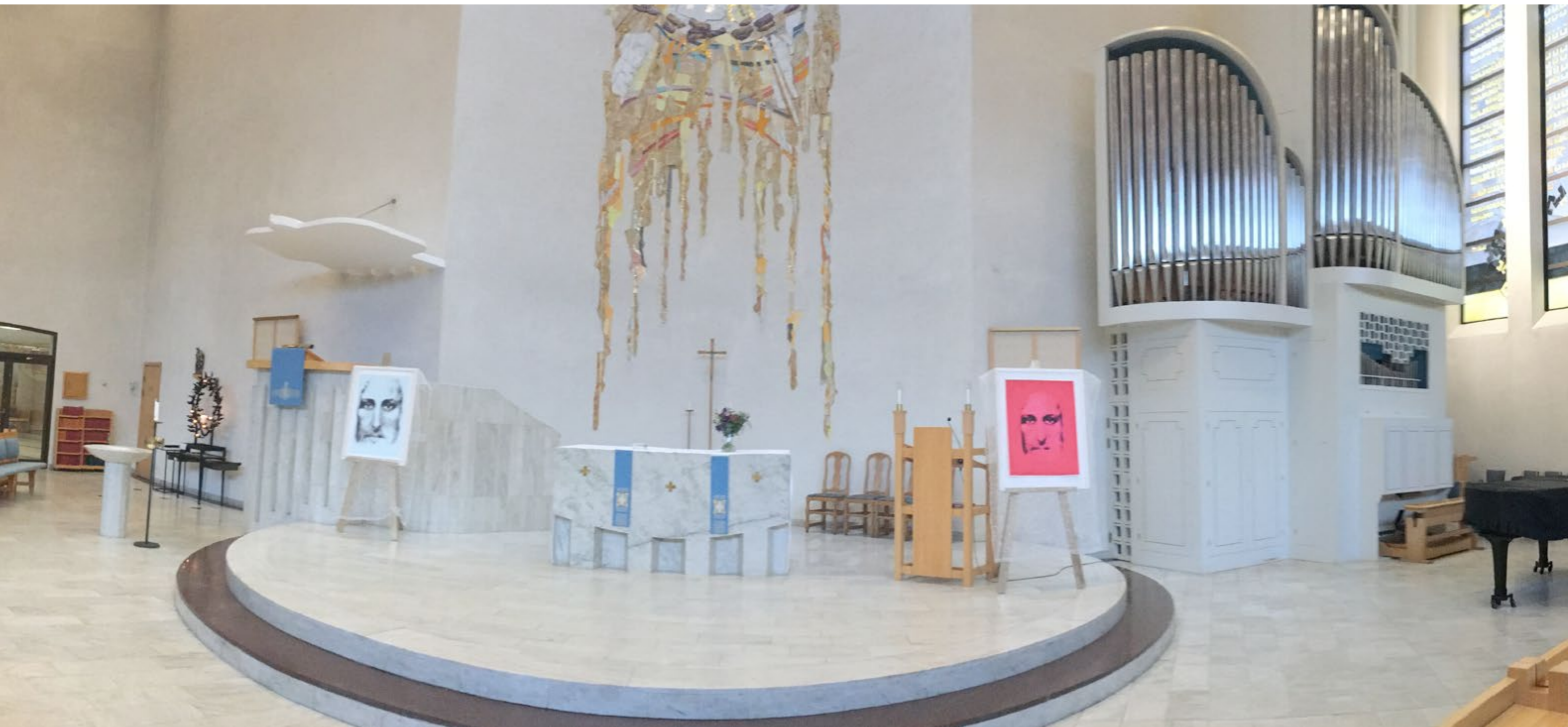
Interiörbild från Mariakyrkan i Skogås-Trångssund med två olika Kristusbilder på Guldstafflier som flankerar själva Huvudaltaret, på invigningen av utställningen. "Den Röda Kristus" hedrar offren för Terrorattacken i Stockholm.