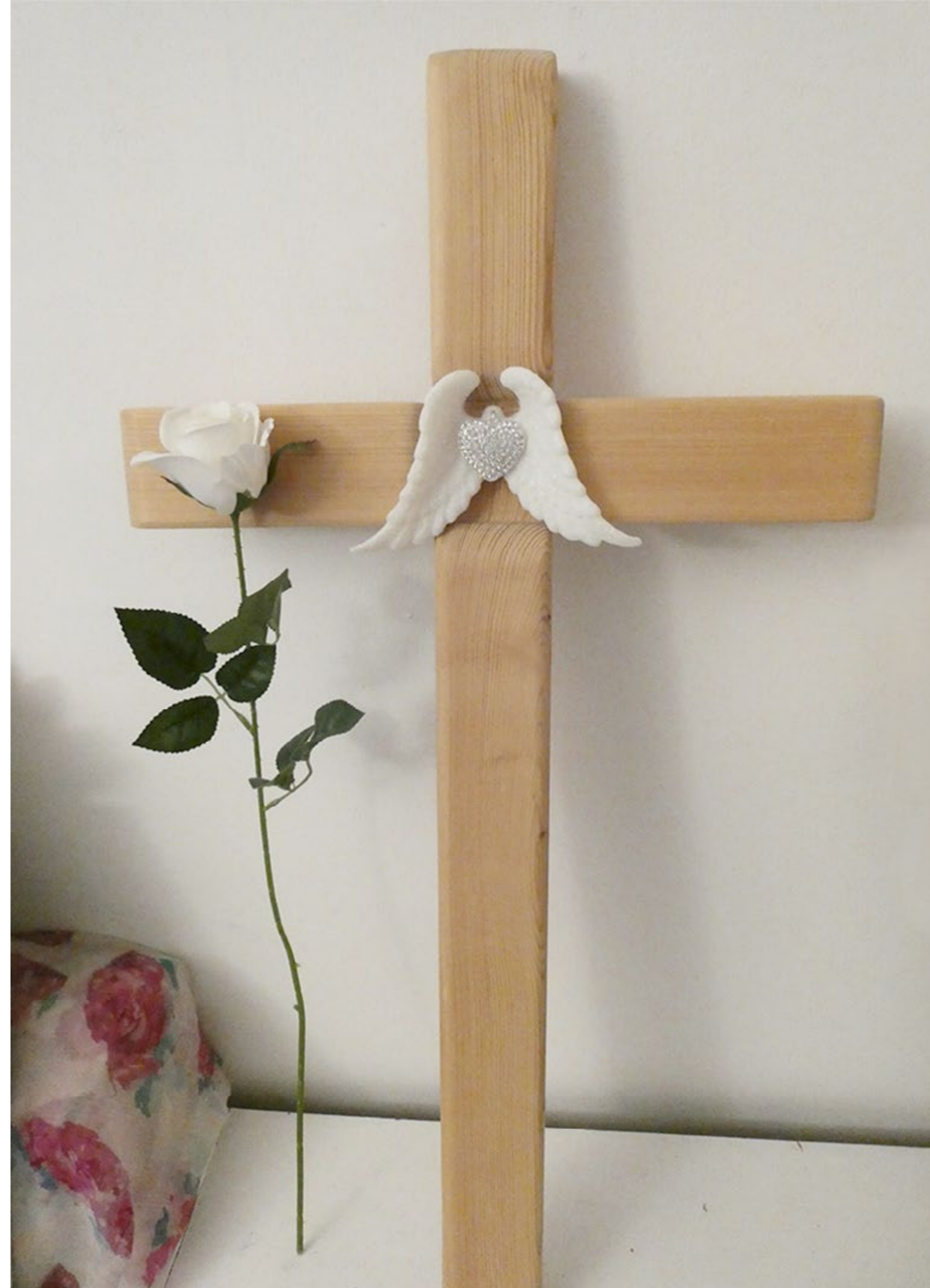
"Änglators", mötte besökarna när de kom in i Hamneda Kyrka. ca 80 x 45 cm, trä, änglavingar, samt ett Juvelhjärta, 2020.