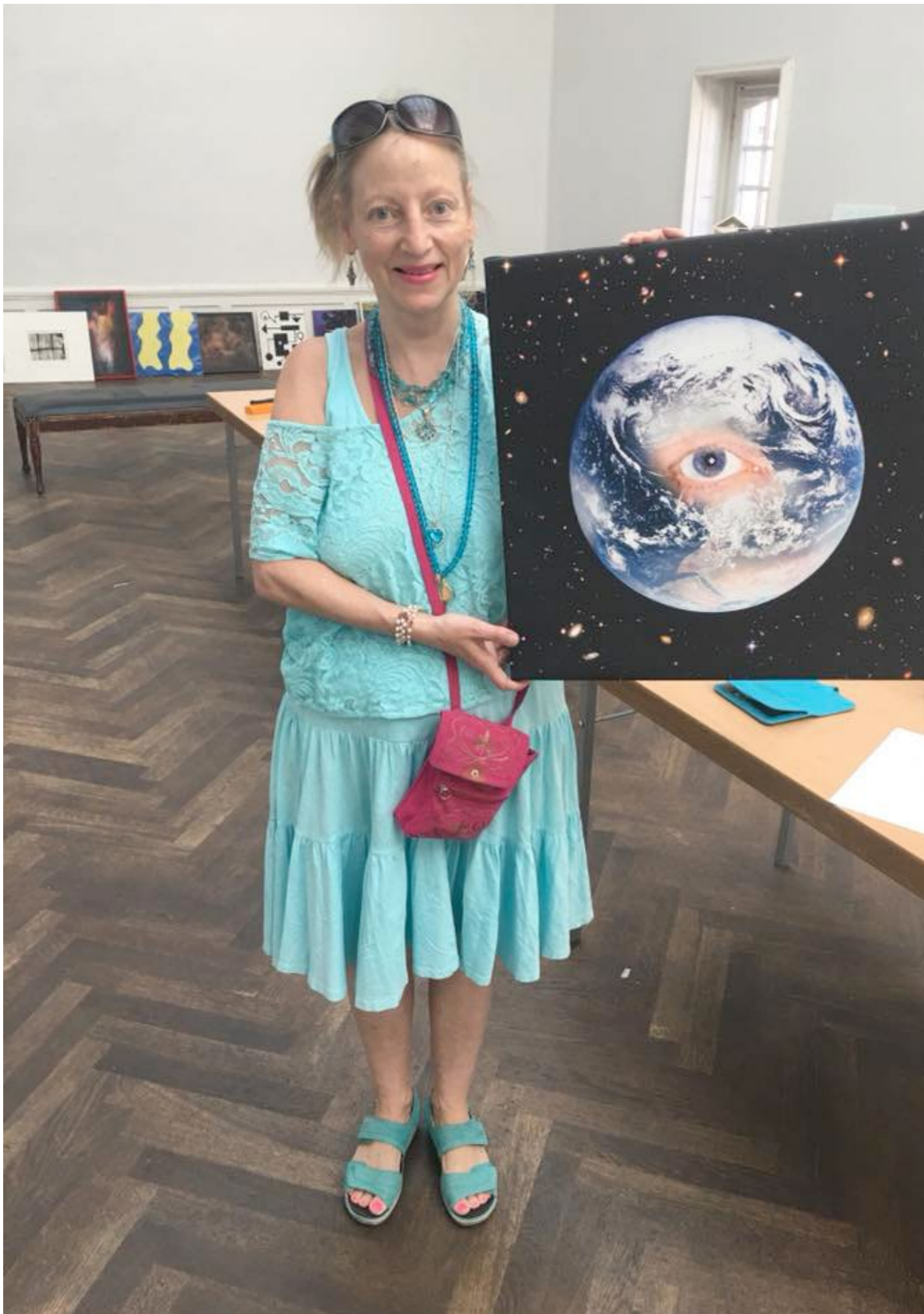
"Earth-Insikt-Utsikt", visad på Konstnärshusets utställning "Utsikter", 2018.