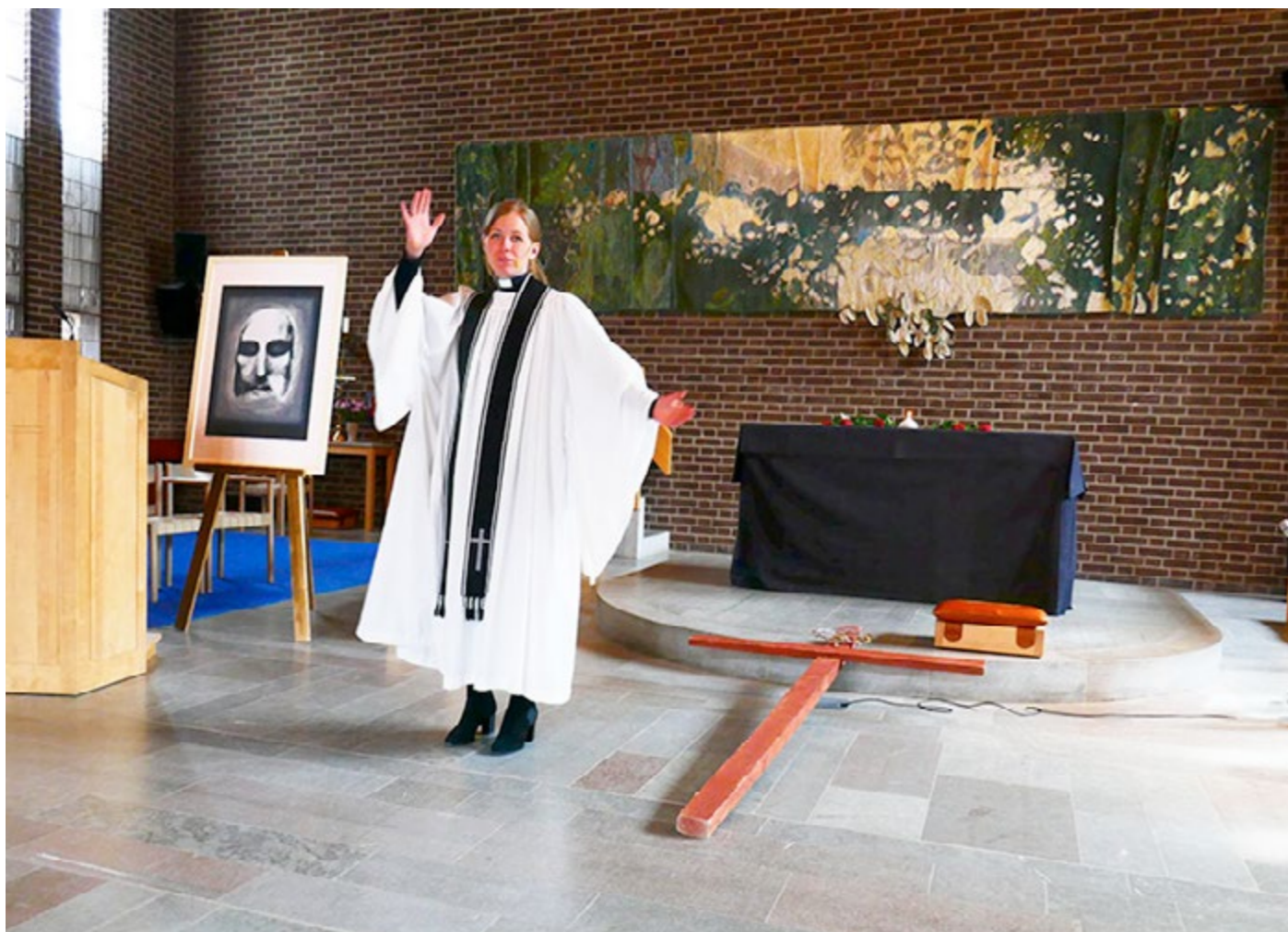
"Altartavla-Svart Kristus", Långfredagen, Skärholmens Kyrka 2017.