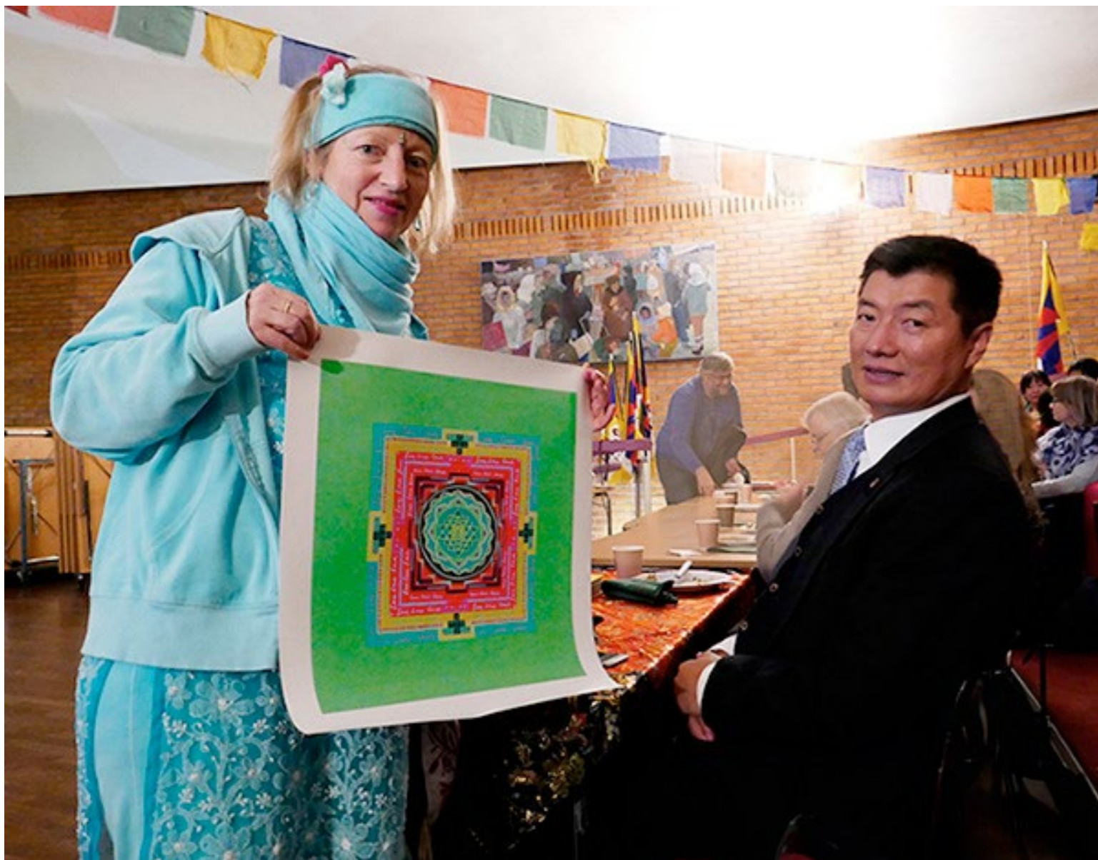
Här överlämnar jag ett Grönt Shri Yantra, till Tibets Nya President, Årsta Folkets Hus 2017, Detta Yantra har även visats på Konstnärshusets Höstutställning 2017, samt "Alla Drömmars Skarpnäck", Skarpnäcks Kulturhus 2017.